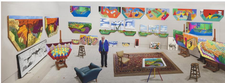
In the studio, December 2017 - [Dans l'atelier, décembre 2017], 2017, dessin photographique imprimé sur 7 feuilles de papier, monté sur 7 feuilles de Dibond, 278 x 760 cm, assisté de Jonathan Wilkinson. Tate: don de l'artiste 2018. © David Hockney

Le musée Granet, présente en partenariat avec la Tate Gallery, une exposition rétrospective du grand artiste britannique, David Hockney - sur plus de 700 m 2 .