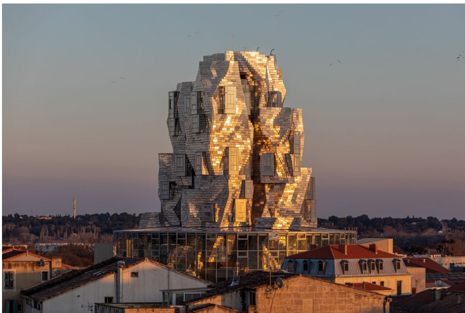
La Tour et ses reflets pendant le coucher du soleil - ©Adrian Deweerdt

Cette remarquable tour en fer abrite des installations d'art moderne immersives dans une ancienne gare de triage des années 1800.